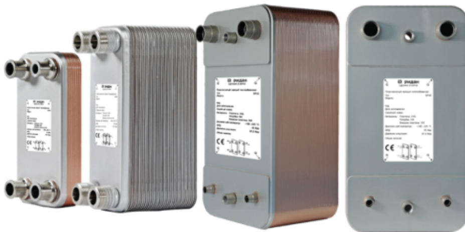
Рис.1 - Внешний вид теплообменников пластинчатых типа ВРНЕ

Теплообменники пластинчатые типа ВРНЕ предназначены для передачи тепловой энергии от одного теплоносителя к другому. Теплообменники пластинчатые типа ВРНЕ могут применяться в холодильных установках (компрессорных, абсорбционных), а также в тепловых насосах. В качестве рабочих сред могут использоваться с ГХФУ, ХФУ, ГФУ, ГФО и природные хладагенты не вступающие в реакцию с медью, технические и холодильные масла, вода для технических нужд и систем ГВС, спиртосодержащие растворы, водные растворы гликолей.